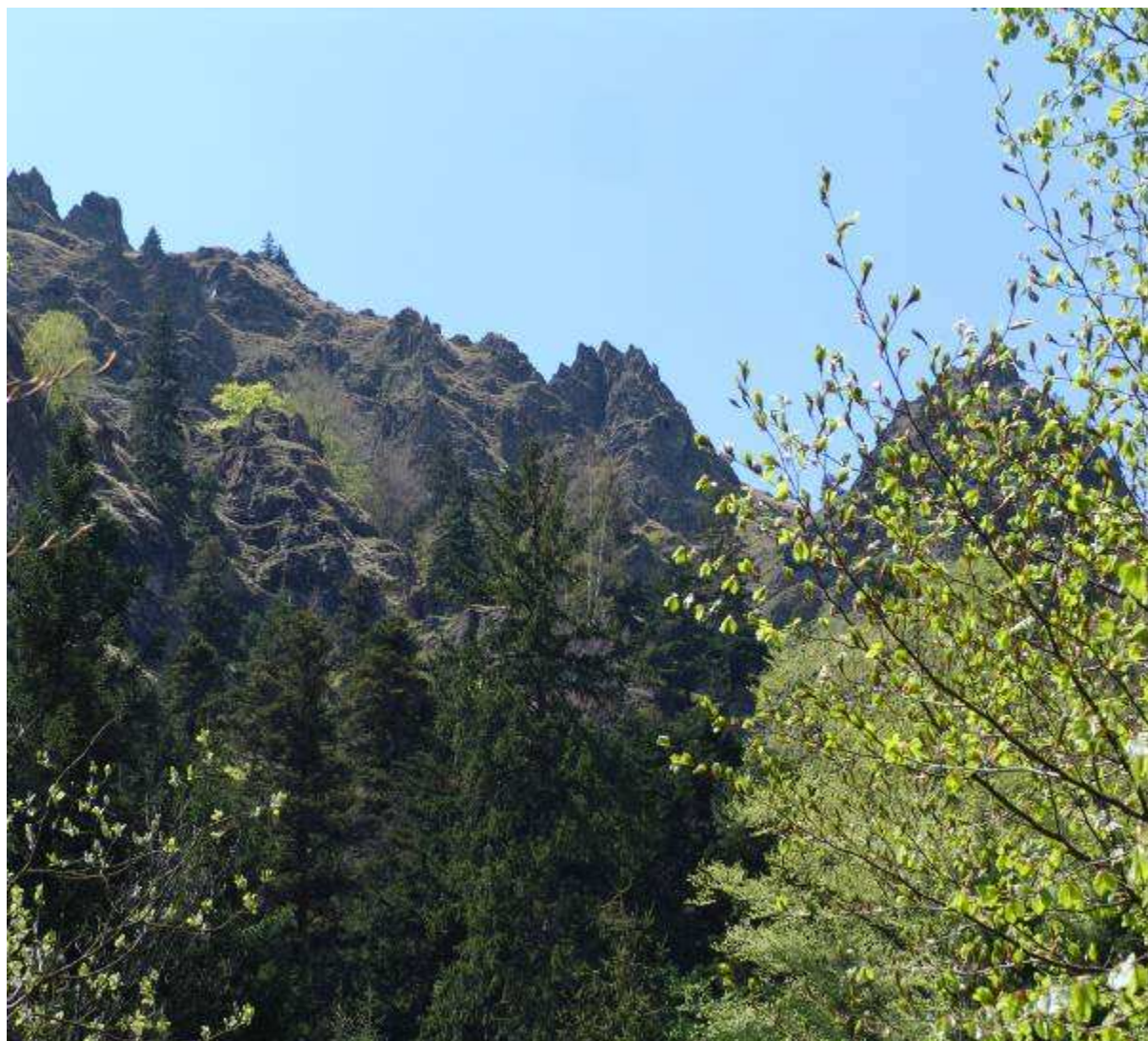
Копаоник, 2011. године